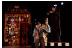
Dans la boutique fantastique.

Prix Frs 60.- avec une entrée comprise au spectacle