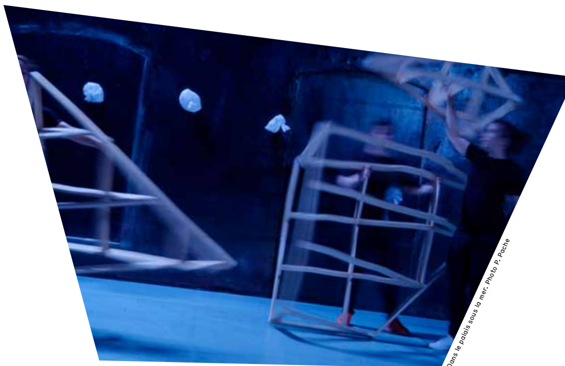
Dans le palais sous la mer.

Ce spectacle a été conçu à partir d'un conte traditionnel coréen. Son titre est SUGUNGGA. En français, on peut le traduire par «les aventures du Roi dragon de la Mer du sud, de la tortue et du lapin sauvage».