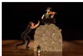
Sur un arbre perché.