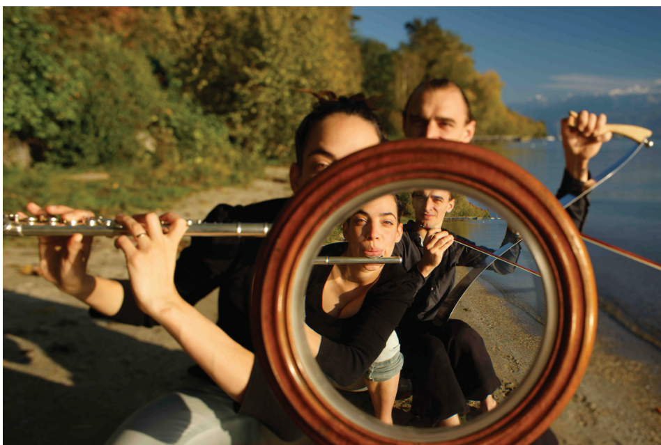
Les sons de la flûte traversière et de la scie musicale pour raconter l'eau.