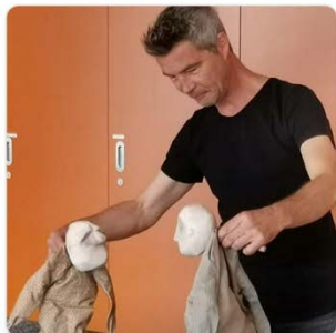
Ouverture officielle de saison et Semaine de la créativité 2023