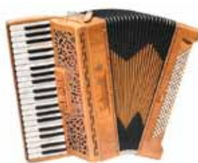
Adrienne joue de l'accordéon.