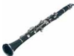
Damien joue de la clarinette.