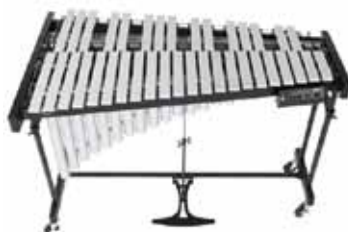
Fantin joue des percussions: vibraphone et tambour basque.