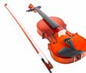
Louise joue du violon.

Et toi, de quel instrument joues-tu? Ou bien de quel instrument aimerais-tu jouer?